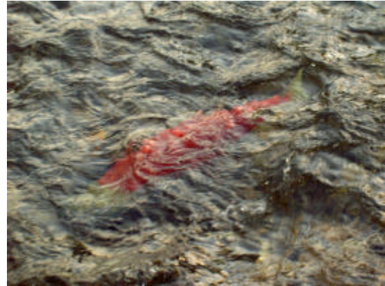
Lachs beim Laichen