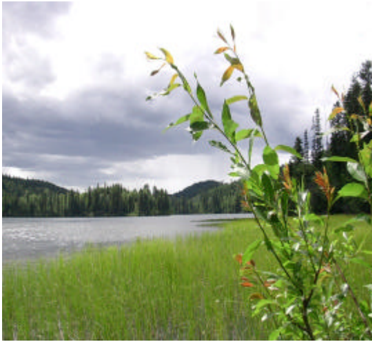
Little Horsefly Lake