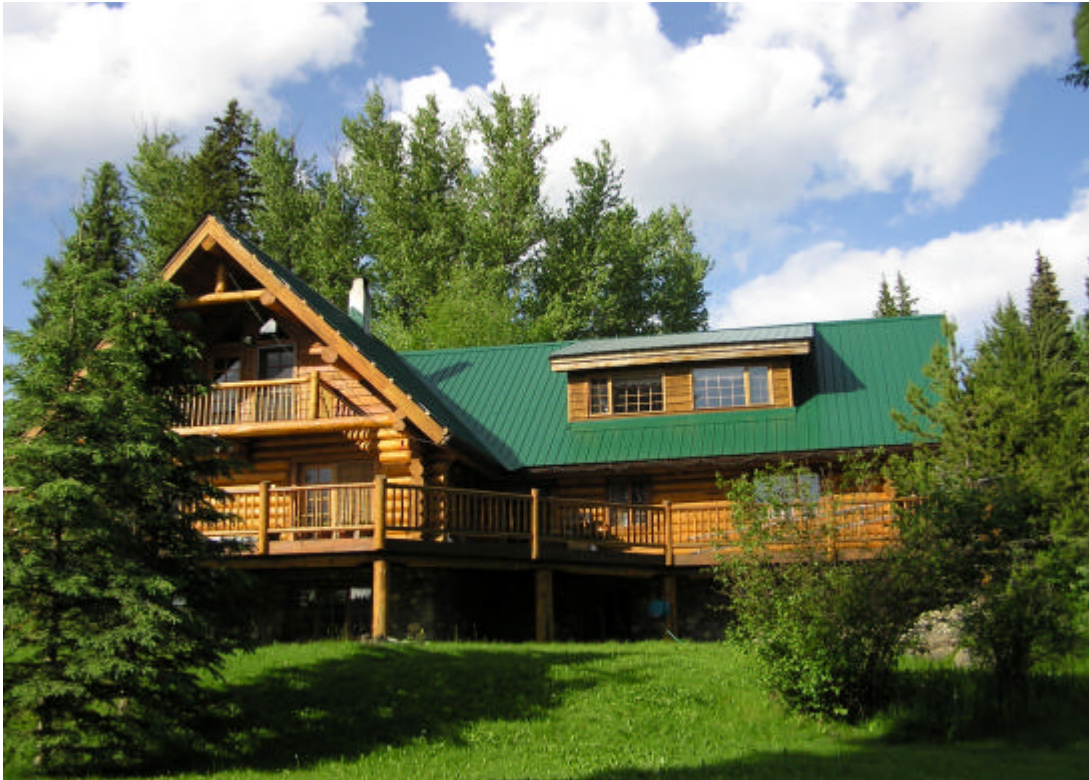
Little Lake Lodge

Erholungssuchende Menschen oder speziell Naturliebhaber finden in der